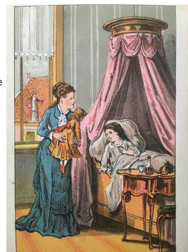
Afbeelding uit De St. Nicolaasavond. J.M.E. Dercksen